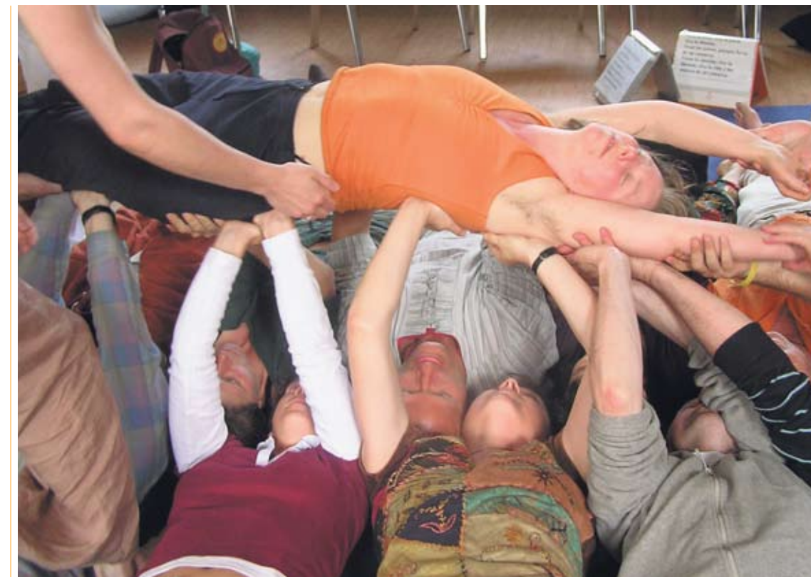
Wer schenkt, erzeugt Vertrauen. Wer vertraut, wird beschenkt.

Was brauche ich wirklich? Eine spannende Frage in Gemeinschaft. Und was schenke ich? Schenke ich wirklich, oder habe ich insgeheim den Anspruch auf Rück-