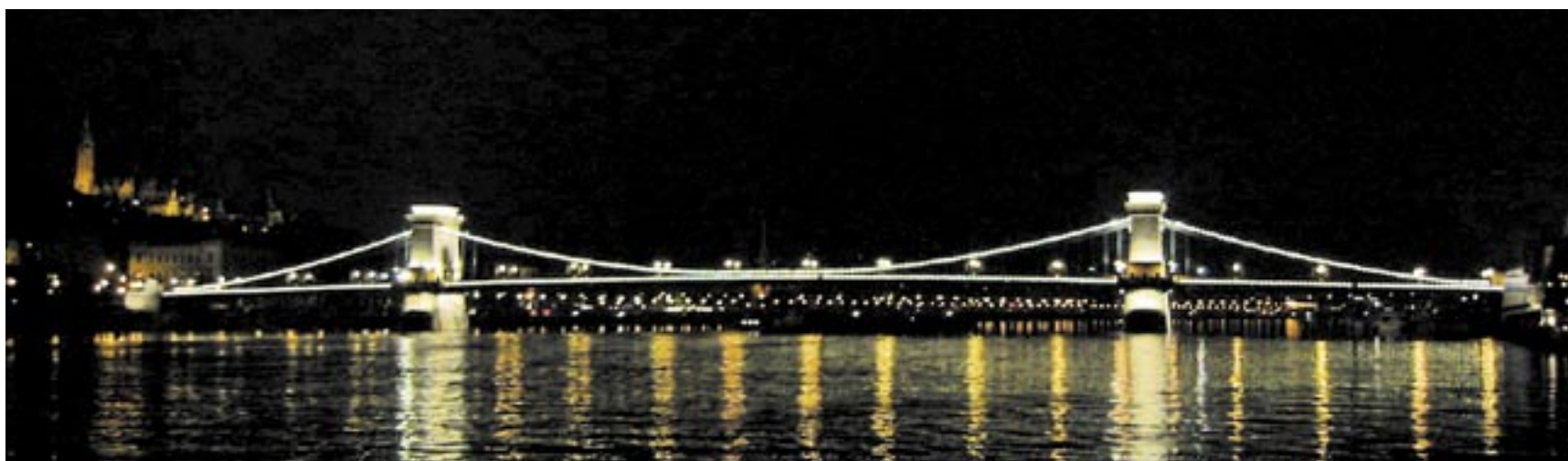
Lánchíd, die berühmte Kettenbrücke von Budapest, wurde zum Emblem des Club of Budapest. Sie verbindet die beiden historischen Städte Buda und Pest und symbolisiert die Bemühung des Clubs um nachhaltige Brücken zwischen den Generationen und Kulturen.

betrachtet, ebenso wahrscheinliche!) positive Perspektive zu ersetzen. An diesem Punkt setzt der Autor Ervin Laszlo an. Nachdem er an der Frage der Nachhaltigkeit noch einmal in bündiger Form die globale Problematik umreißt (Bevölkerungsdruck, Armut, ungleiche Ressourcenverteilung, religiöse Intoleranz, Wasserknappheit, Klimawandel, Umweltverschmutzung, Artenschwund etc.) zeichnet er zwei völlig unterschiedliche und dennoch gleichermaßen realistisch anmutende Zukunftsszenarien: